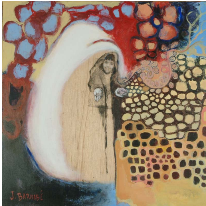
(faisant partie du corpus Liane Nord-Sud...) Nombriil du monde #8 impression d'une photo, acrylique et encre sur bois 50 x 50 cm 2002

... un monde où la diversité est un atout et où tant l'individualité que la collectivité sont sources de richesse, où les échanges fleurissent sans contraintes, où les paroles, les chants et les rêves bourgeonnent. Ce monde considère la personne humaine comme une des richesses les plus précieuses. Il y règne l'égalité, la liberté, la solidarité, la justice et la paix. Ce monde, nous avons la force de le créer."