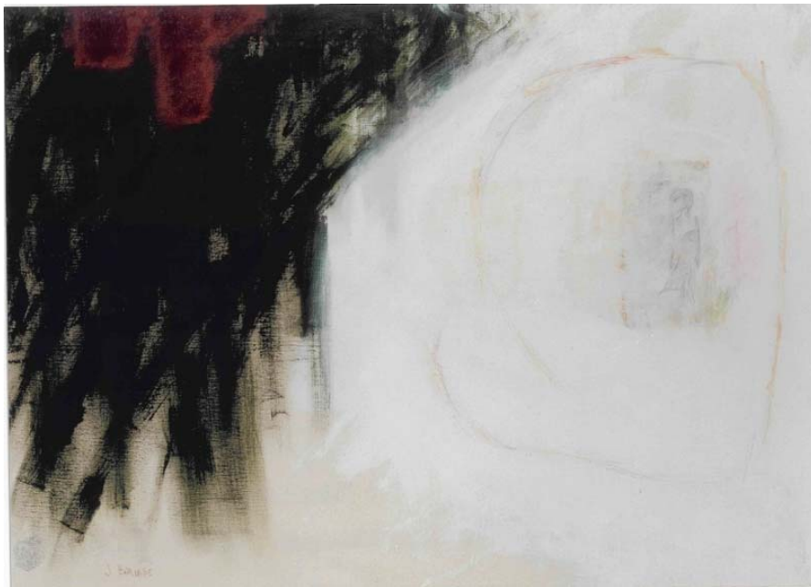
Somalie, suite et fin acrylique, collage et dessin sur toile 94 x 105 cm. 1998

Touchée par la situation des enfants dans le monde, j'ai commencé, il y a plusieurs années, à accumuler des photos d'enfants du monde, recueillies çà et là, dans des journaux et des revues d'actualités, avec la vague intention de créer une oeuvre d'art social. Les premières oeuvres exploratoires que j'ai réalisées en atelier étaient très sombres. Il s'agissait de 3 tableaux et de quelques ébauches qui portaient le signe de la violence, du désespoir ou de la mort. Elles exprimaient crûment la dure réalité de ces enfants.